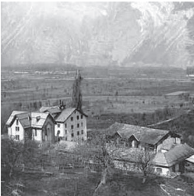
1969 : un groupe de fervents catholiques rachète la maison et le domaine d'Écône mis en vente par les chanoines du Grand Saint-Bernard.

1969-1970 : c'est l'année cruciale pour l'Église qui se voit imposer la nouvelle messe. À Fribourg les débuts sont difficiles : maladie de Mgr Lefebvre, départs de plusieurs séminaristes. À la même époque, en Valais, un groupe de fervents catholiques rachète la maison et le domaine d'Écône mis en vente par les chanoines du Grand Saint-Bernard. Leur but est de sauver les bâtiments d'un usage profane, car ils ont le ferme espoir de garder à la propriété une finalité religieuse. Bientôt, ils en font don à Mgr Lefebvre qui décide, dans un premier temps, d'y installer l'année préparatoire ou de spiritualité qu'il veut instituer avant les études de philosophie et de théologie. C'est ainsi qu'à la rentrée